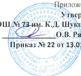
График оценочных процедур МОУ «СОШ № 73 им. К.Д. Шукшина»